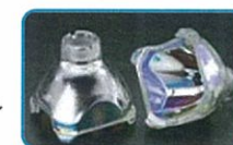
プロジェクター用反射鏡