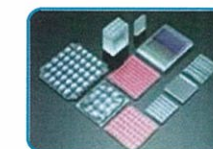
フライアイレンズ