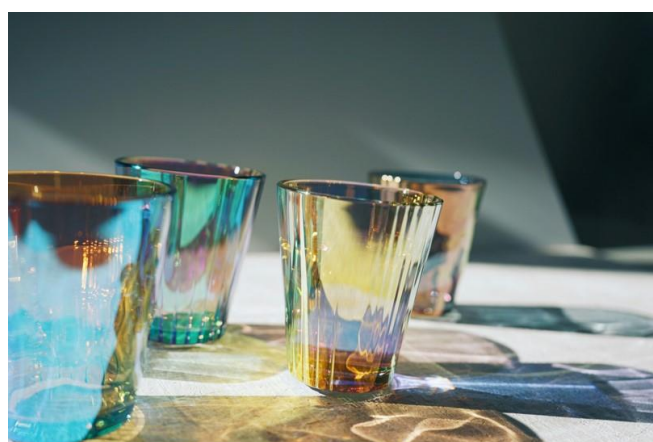
反射と影が織りなす 2 色の美しいコントラスト