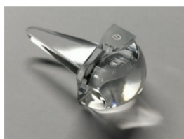
《新導光体デバイス》(一例)