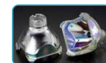
プロジェクター用反射鏡