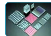
フライアイレンズ