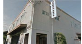
大阪営業所(大阪府吹田市) 光学、照明、機能性ガラス、薄膜製品等の販売及び調達