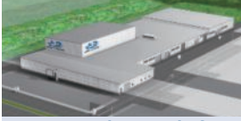
JAPAN 3D DEVICES 株式会社(新潟県柏崎市) 電子・光学機器の製造、加工及び販売