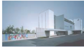
本社ガラス事業所(千葉県柏市) 光デバイス用ニューガラス等の製造・販売