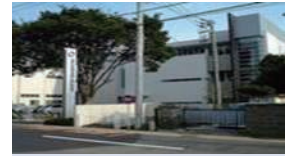
薄膜事業所(千葉県柏市) 各種薄膜製品の開発、製造