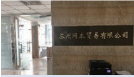
SUZHOU OKAMOTO TRADING CO., LTD.(中国) 光学、照明、機能性ガラス、薄膜製品等の販売及び調達