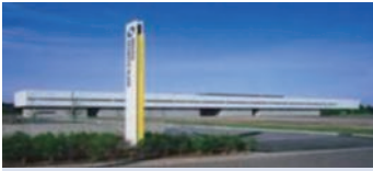
新潟岡本硝子株式会社(新潟県柏崎市) プロジェクター用反射鏡及び化粧品瓶への加飾蒸着等の各種薄膜製品の製造