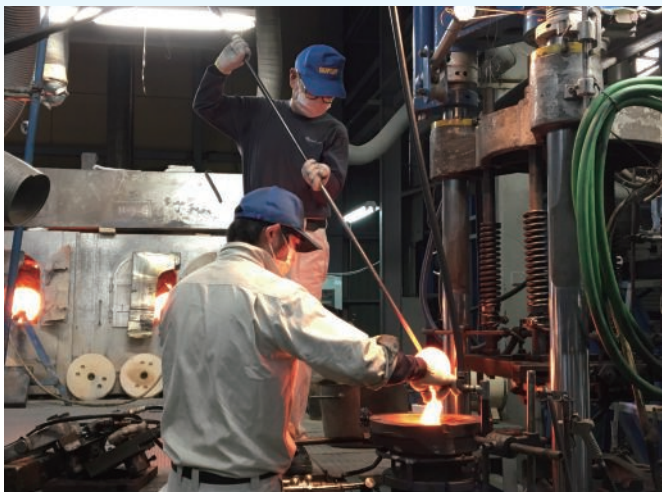
1200度の液体状のガラスを扱う職人技が岡本硝子を支えている(巻き手は社歴50年を超え、ガラスばさみを持つ若手は30代)

社が約30年前から培ってきたガラスに薄い膜を付ける技術です。お椀型のような形状のある立体的な製品に、ナノメートル(10億分の1メートル)単位で数十層の薄膜を均一に、あるいは厚