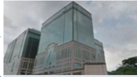
OKAMOTO OPTECH CO., LTD.(台湾) 光学、照明、機能性ガラス、薄膜製品等の販売及び調達