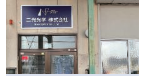
ニ光光学株式会社(神奈川県相模原市) 真空蒸着製品の製造、加工及び販売