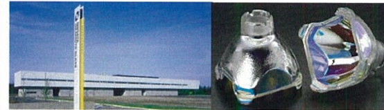
蒸着工程(2008年4月以降)